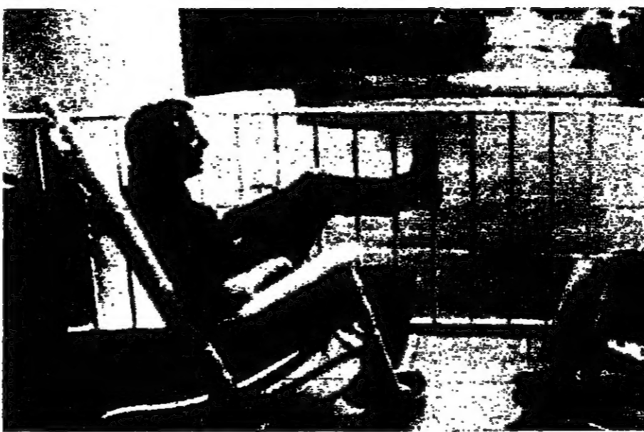
كارتر روزالين يجلسان على شرفة ترومان في البيت الأبيض

ولكن الرئيس كارتر لم يكتف هذه الرحلة بونه ، وقد تمهد بذلك كل ما يمكن لاجراء سياسة سلمية ، وقال انه لا يزال يامل بإمكان استئناف محادثات السلام في جنيف في وقت لاحق من العام الحالي ، وربط من جديد مسعته الشخصية بجهود الوساطة ، وقال انه مستعجل الى وزراء خارجية اسرائيل والدول العربية في واشنطن نهاية ايلول ، وموقف الرئيس كارتر يعتبر جزءا من جهود وموقف نقل التفويض الأمريكي كله على جيبس لانقاذ الامنية ، في وقت تصير فيه القضية لتتجه نحو السلام افضل منها في أي وقت مضى منذ ٢٠ عاما ، ويريد فيه جميع الأطراف لسلام في المنطقة ، مستراتيجية